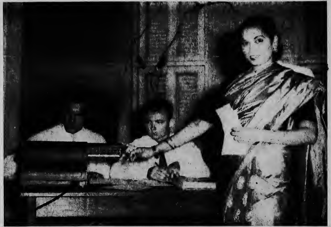
Miss Shakuntala Devi, het Indiase rekenwonder, dat Maandagavond voor een talrijke publiek onder auspiciën van de Volksuniversiteit Aruba enkele staaltjes van haar kunnen vertoonde ziet men hier met haar beide controleurs achter de elektrische rekenmachine.

LONDEN. — Stanley Matthews, die veertig jaar oud werd, meldde zich als eerste op de training van de voetbalclub Blackpool. Hij kreeg vele gelukwensen, waaronder een van Ernae Puskas namens het Hongaars elftal. Een andere gelukwens was geadresseerd aan „Mr Football“.